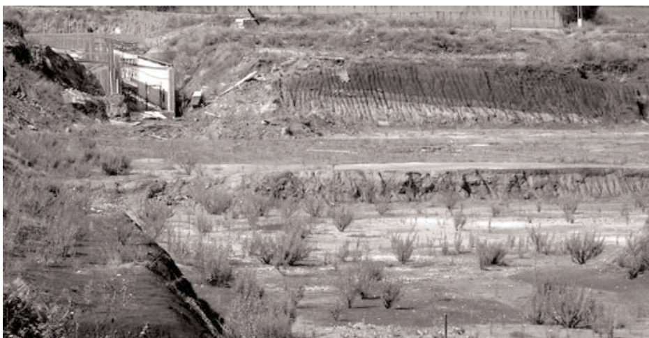
Il cantiere del nuovo ospedale, teatro del più grande scandalo della storia di Vibo Valentia

Nuovo ospedale: ricostruzione di una vicenda segnata da lobbies di potere e diffuso malaffare