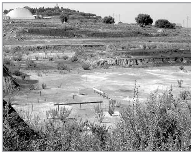
TUTTO IMMOBILE Il cantiere per la costruzione dell'ospedale