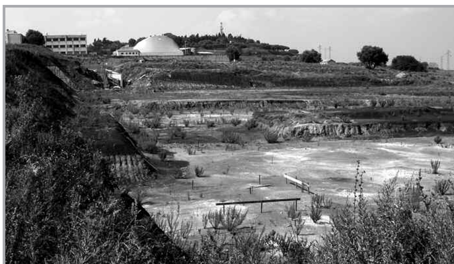
IL SOGNO INFRANTO Sopra il progetto del nuovo ospedale. Sotto il cantiere morto