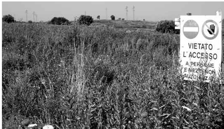
MORTO Ecco il cantiere del nuovo ospedale, "morto" prima ancora di essere costruito

Sanitopoli, il giudice ricostruisce il profilo dei personaggi