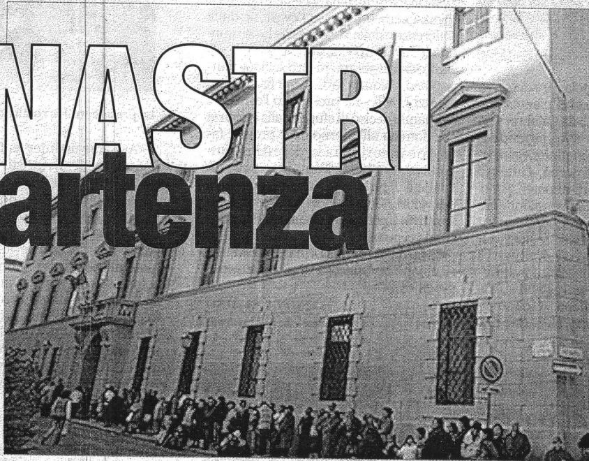
Palazzo de Nobili, sede del Comune